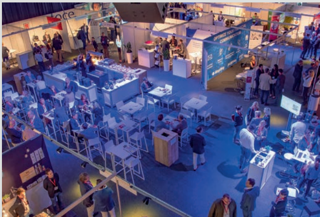
2018 – Docks Dome Brussel (18 oktober)