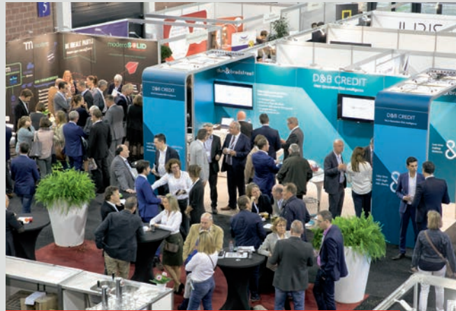
2016 – Brabantthal Leuven (20 oktober)