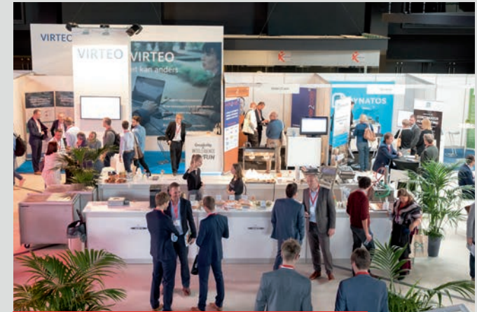
2017 – Flanders Expo (19 oktober)