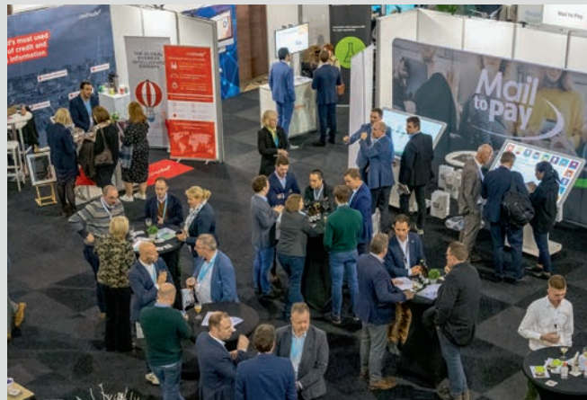
2019 – Brabantthal Leuven (21 november)