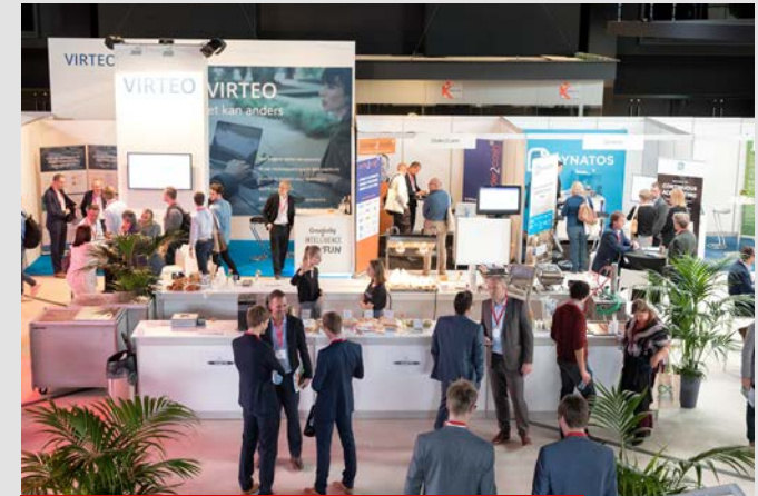
2017 – Flanders Expo (19 oktober)