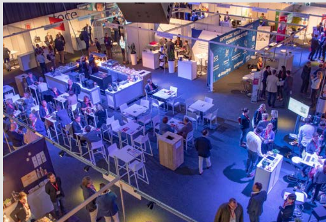
2018 – Docks Dome Brussel (18 oktober)