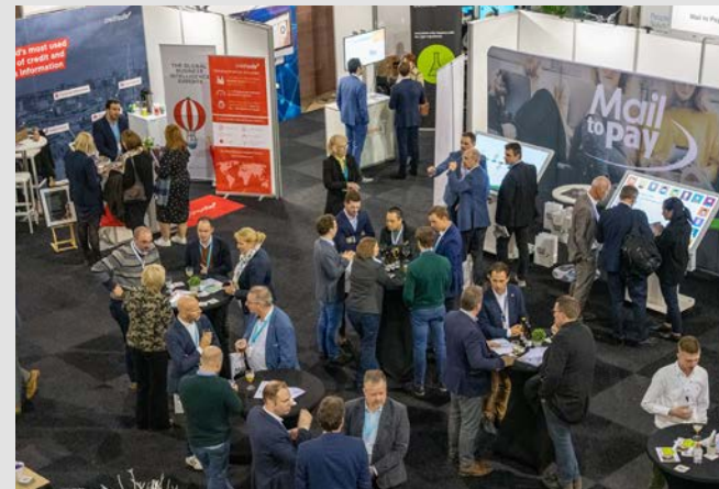
2019 – Brabant Expo Leuven (21 november)