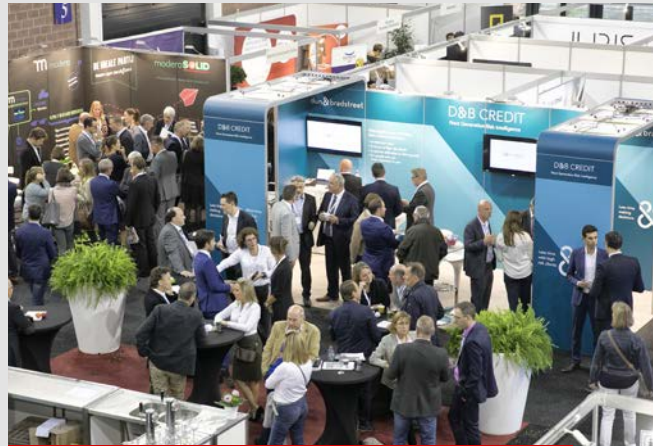
2016 – Brabant Expo Leuven (20 oktober)