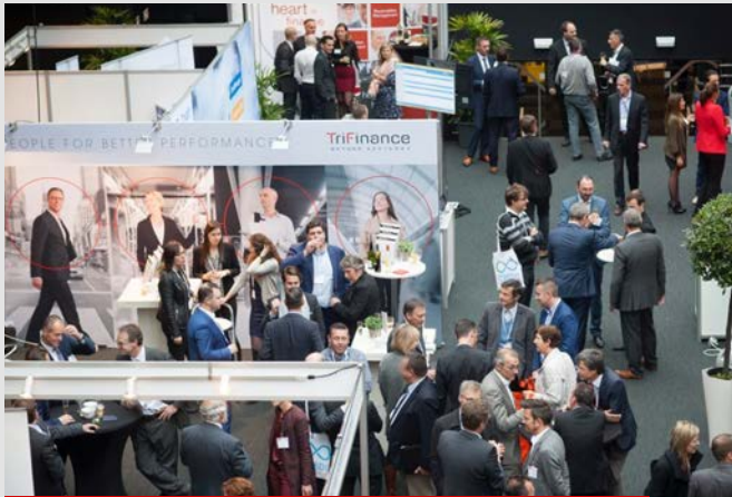
2015 – Flanders Expo Gent (14 oktober)